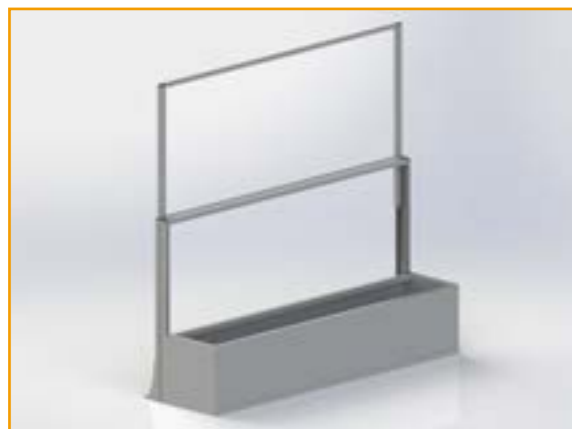
Opción cortavientos + macetero con soporte estandar a suelo.