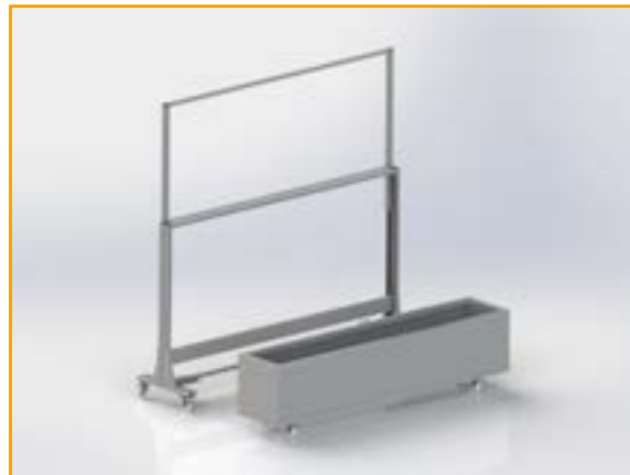
Opción cortavientos + macetero con soporte de ruedas.

Acondicione su terraza con el nuevo macetero para su cortavientos